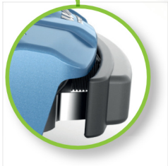
Pare-chocs avant mobile avec détection de collision et système de capteur d'obstacles efficace.