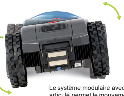
Le système modulaire avec bras articulé permet le mouvement indépendant des 2 parties du robot assurant ainsi une grande capacité de traction et un résultat de tonte inégalé.