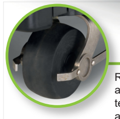
Roues avant inclinables, avec une mise à niveau automatique. Pour suivre parfaitement le relief du terrain, avec une forte traction même sur un sol accidenté. LIFT SENSOR: lorsque le robot est soulevé, le moteur de coupe s'arrête immédiatement.