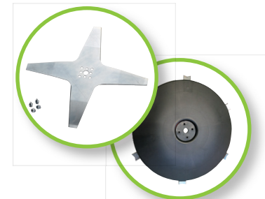
La lame de coupe en acier est silencieuse et les performances sont parmi les meilleures du marché quelque soit le type de gazon ou de terrain (25 cm).