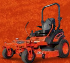
SÉRIE ZX (24-25 CH)