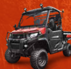
K9 (24 CH)