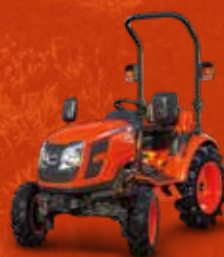
SÉRIE CX10 (25 CH)