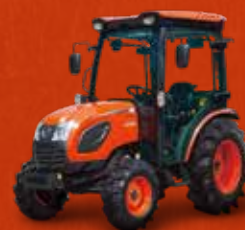
SÉRIE CK30 (25-50 CH)