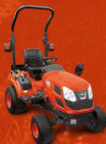
SÉRIE CS (21-25 CH)