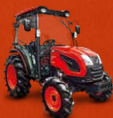
SÉRIE DK20 (45-60 CH)