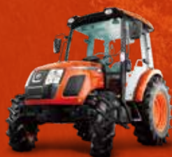
SÉRIE RX (66-73 CH)