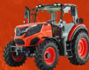
SÉRIE HX (90-115 CH)