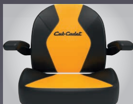
GRAND SIÈGE CONFORT AVEC ACCOUDOIRS