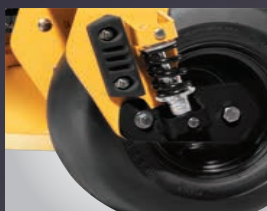
TRAIN AVANT AMORTI