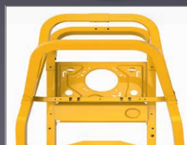
CHÂSSIS TUBULAIRE 38X76 MM