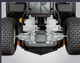
DOUBLE TRANSMISSION HYDROSTATIQUE