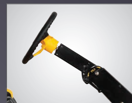
COLONNE DE DIRECTION AJUSTABLE