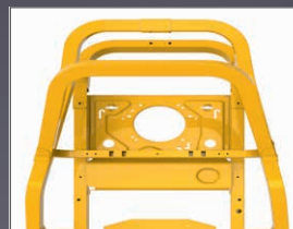
CHÂSSIS TUBULAIRE 50X50 MM