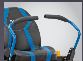
LEVIERS AVEC GRIP SOFT TOUCH ANTI-VIBRATION