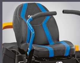
GRAND SIEGE CONFORT